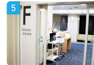
1階 放射線科(レントゲン)受付