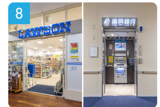
1階 コンビニ/福岡銀行ATM