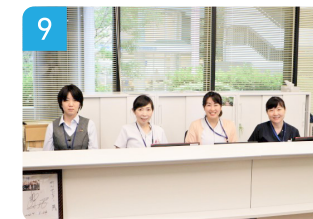
1階 がん相談支援センター