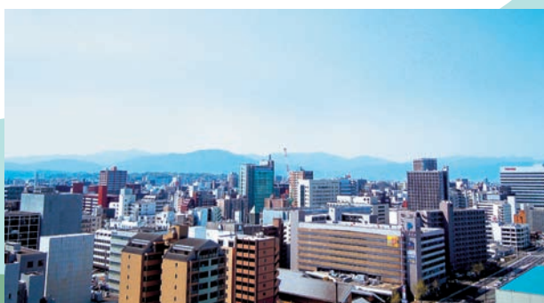
病室からの風景（左・北側、右・南側）