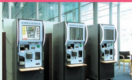
自動精算機または窓口