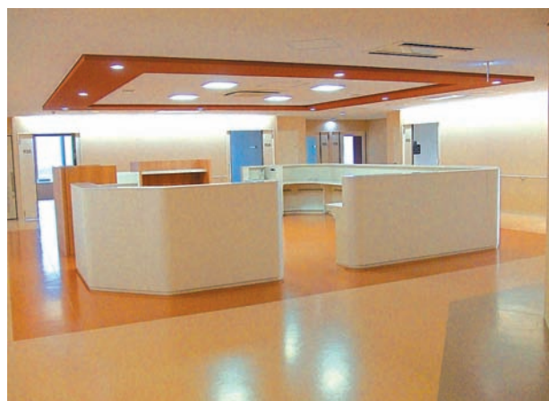
スタッフコーナー

また、旧病院ではトイレをはじめ設備面でご迷惑をおかけしておりましたが、新病院では心地よくご使用していただけるものと思います。