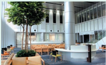
中央受付の初診受付カウンター (紹介状をお持ちの方は提出をお願いします)