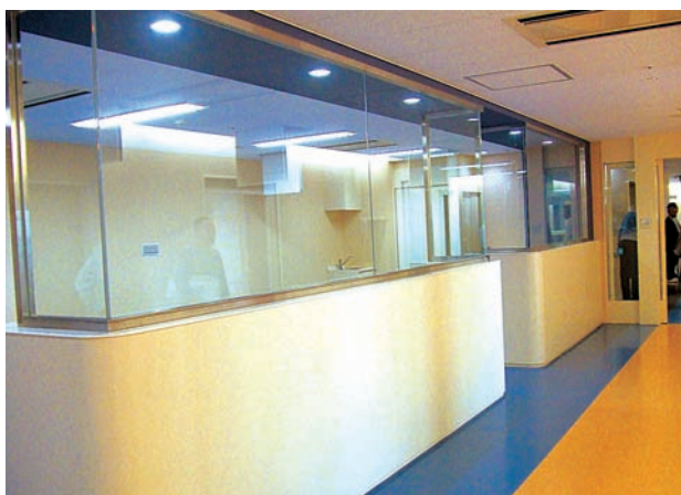
スタッフステーション

病棟は4階と6階～9階です。1フロアに2つの病棟が入っています。海側（北）はAB病棟、街側（南）はCD病棟。呼び名がちょっと変わっています。海側はブルー、街側は煉瓦色となっておりますので、壁の色でどこにいるのかわかります。病棟の中央にスタッフステーションと2つのスタッフコーナーがあります。病室に近いので、患者さんに安心して療養していただけたらと思います。